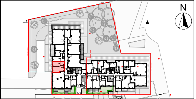
APPARTEMENT A03 BATIMENT A ETAGE RDC 2 PIECES

Voie François PEATRIK 92350 LE PLESSIS-ROBINSON