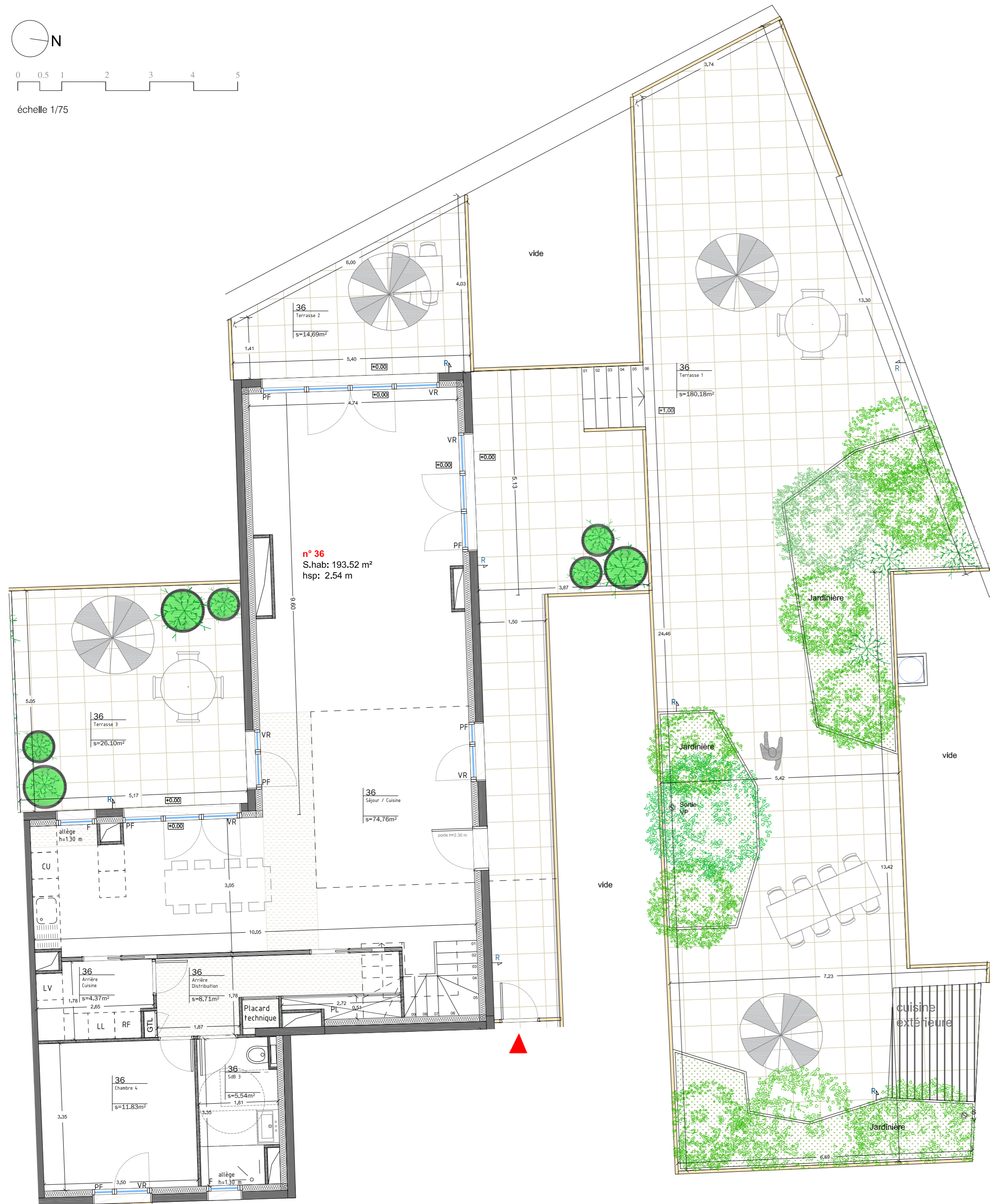
PLAN NIVEAU BAS